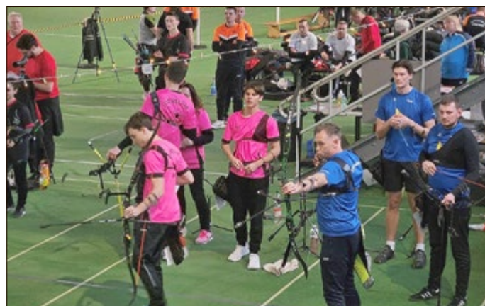
Spitzenduell gegen Erfurt

In Saalfeld werden die Teams erneut auf starke Konkurrenz treffen. Besonders die Regionalligamannschaft wird sich auf packende Duelle mit Stahl Unterwellenborn und dem SV Erfurt-West vorbereiten müssen. Trainer und Mannschaft zeigen sich jedoch zuversichtlich: „Wir sind heiß auf den nächsten Spieltag und wollen uns weiter steigern.“