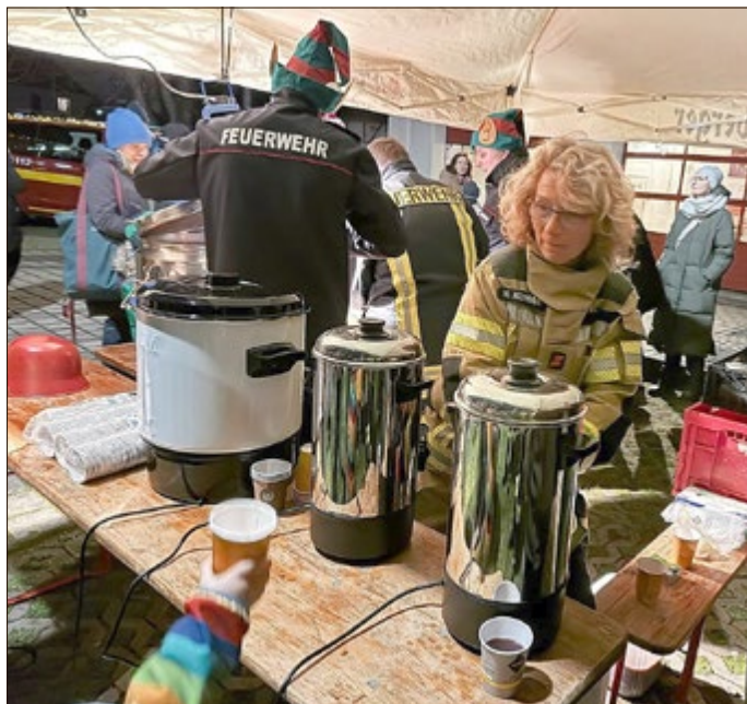
gez. U. Hasert Feuerwehrverein Wandersleben