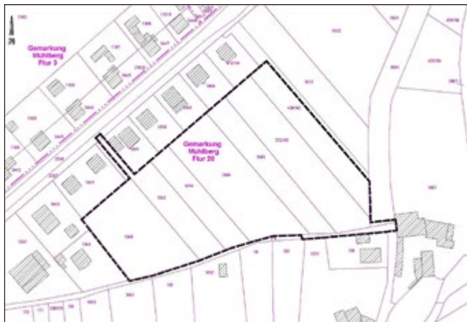
Gemeinde Drei Gleichen - Übersichtslageplan zum Geltungsbereich der 1. Änderung des Bebauungsplanes für das Allgemeine Wohngebiet (WA) „Auf der Pferdekoppel“ im Ortsteil Mühlberg

Anlage: Übersichtslageplan zum Geltungsbereich der 1. Änderung des Bebauungsplanes