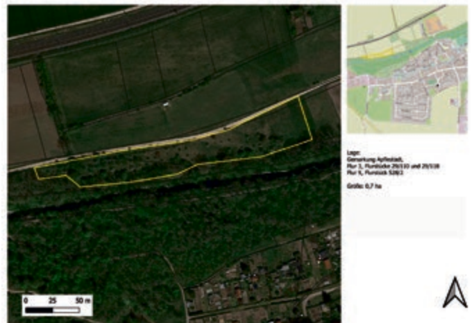
2 Fläche C: Apfelstädt Flur 3 und Flur 9, insgesamt 0,7 ha