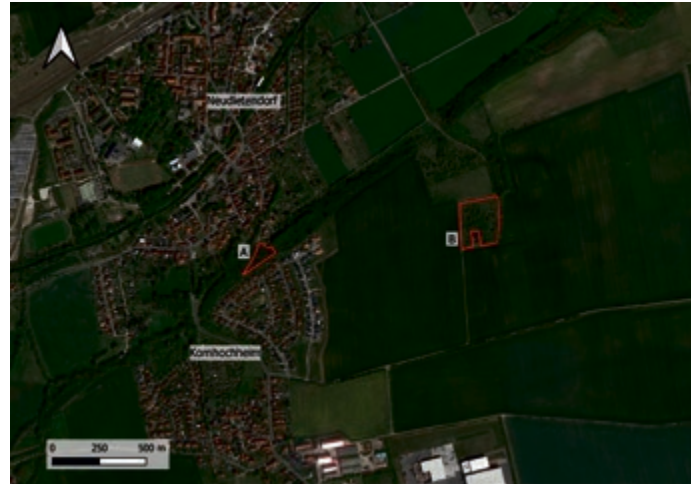
1 Fläche A: Neudietendorf, Flur 1, Flurstück 247/1 rund 0,3 ha – Fläche B: Neudietendorf, Flur 4, Flurstück 668 rund 2 ha