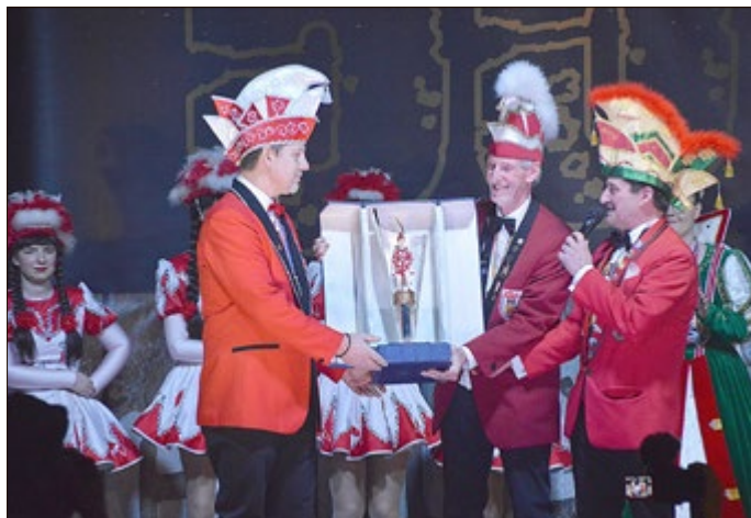
Präsident Köhler erhält den „Konrad“, den Wanderpokal für den Ausrichter des Kreiskarnevalsanzuges in Waltershausen

Ganz besonders freut sich der Verein darüber, den Zuschlag zum Kreiskarnevalsanzug zu erhalten zu haben. Das wird wieder ein echtes Highlight und krönt gewissermaßen auch die 50. Saison im nächsten Jahr mit einem weiteren närrischen Höhepunkt.