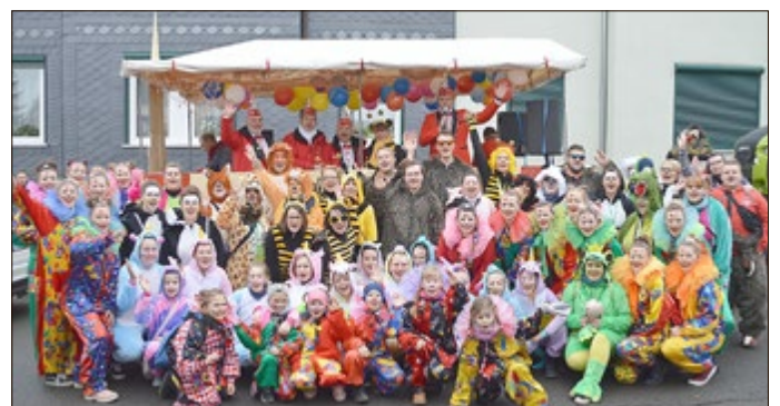
Gruppenfoto des WCV beim Kreiskarnevalsanzug in Waltershausen

Unter dem Motto „Jetzt geht's los, die Spannung, die ist riesen-groß!“ feierte der Wechmarer Carneval Verein seine 49. närrische Saison.